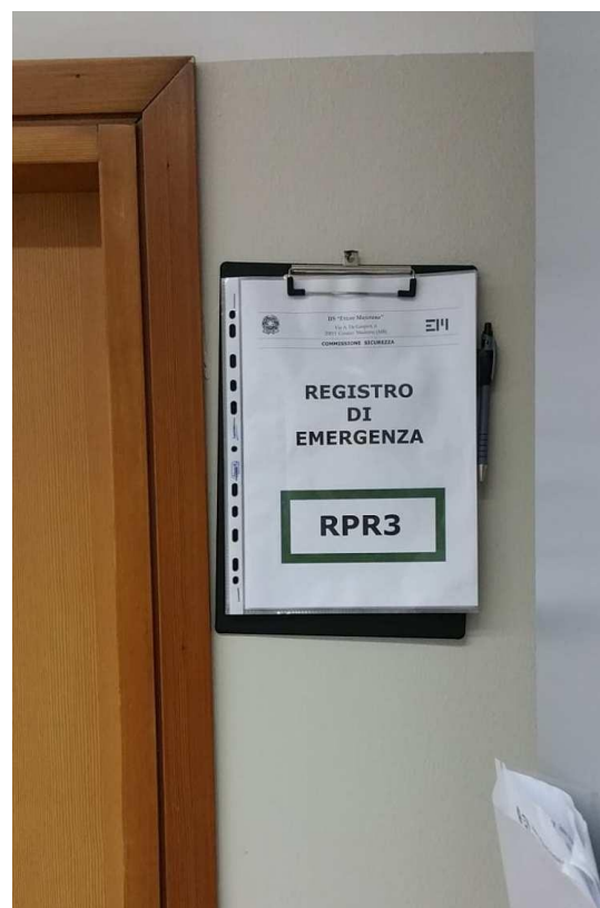
POSIZIONATO A LATO DELLE PORTE D'USCITA